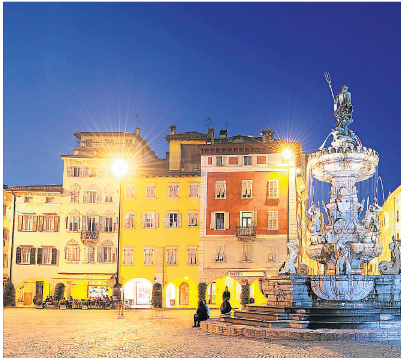
La plaza del Duomo de Trento, una ciudad de rica historia –sede del célebre concilio– pero con ambiciosos proyectos para el siglo XXI

“Creo que la Universidad de Trento comprendió antes que otras que hoy estamos en un mercado y que las familias, debido a la crisis, están cada vez más atentas a qué estudiarán sus hijos y